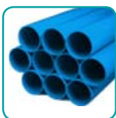
Rohr 2m ABS050