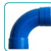
Bogen90° i-i ABS952