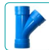
Abzweiger 45° ABS053