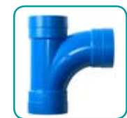
Abzweiger 90° ABS953