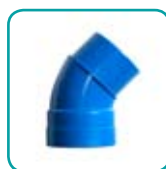
Bogen 45° i-a ABS051