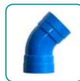
Bogen 45° i-i ABS052